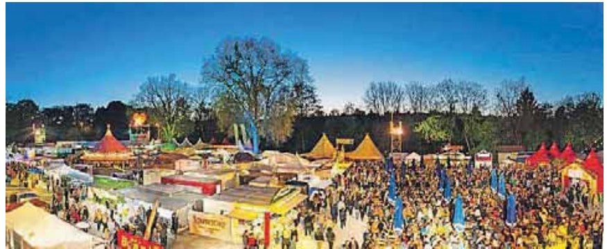
Abendstimmung Uferlos Festival