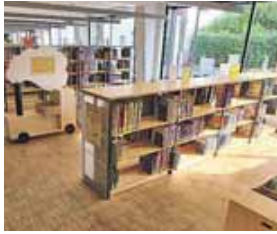
Die großzügige Kinderabteilung der Stadtbibliothek Freising.

FREISING (red) · Die Stadtbibliothek Freising bietet alle zwei Wochen dienstags »Gemütliche Vorleserunden für die Kleinen« an. Die beliebte Reihe richtet sich an Kinder im Alter von drei bis vier Jahren in Begleitung eines Erwachsenen. Beginn ist jeweils um 15.30 Uhr. Die Veranstaltung dauert 30 Minuten, der Eintritt ist frei. Die nächste Vorleserunde findet am 07. Mai 2024 statt mit dem Buch »Das brauch ich alles noch!«. Hermann Graß erzählt, warum Tim alle Sachen noch braucht, die sein Vater findet. »Wenn die Sonne schlafen geht« – vom Träumen, Schlafengehen und Herumgeistern handelt das Buch, aus dem Martina Springer am 21. Mai 2024 vorliest. Am 04. Juni 2024 liest Martina Springer aus dem schönen Buch »Mama und ich« vor. Die Kinder erfahren, warum kleine Bären unwiderstehlich sind und die Welt voller Wun-