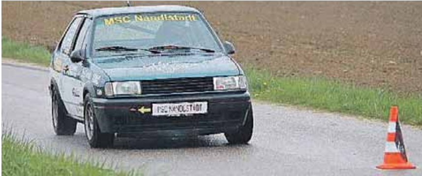
Kurvig und manchmal auch rutschig geht es zu beim ADAC-Slalom.

NANDLSTADT (chö) · Die Fahrer stehen in den Startlöchern und lassen die Motoren bereits aufheulen. Mit Spannung erwarten alle Rennsportbegeisterten den Startschuss der siebten ADAC-Slaloms in Nandlstadt. Los gehts am Sonntag, 5. Mai, ab 8.30 Uhr auf dem Gelände des MSC Nandlstadt e.V. in Faistenberg. Die Veranstaltung ist wie immer auf 80 Teilnehmer begrenzt. Die Anmeldung kann unter www.motorsport-niederbayern.de , bis 30 Minuten vor Rennbeginn erfolgen.