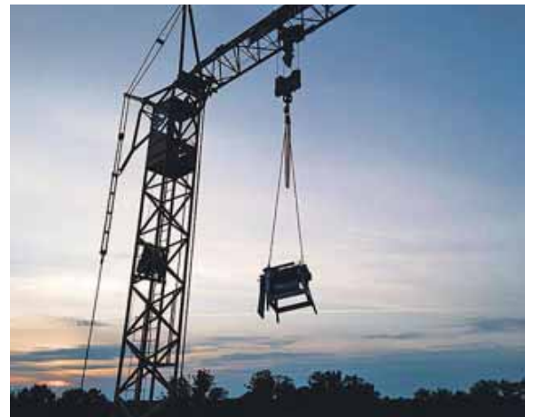
Hängepartie: Auf dem Bau liegt ein Streik in der Luft.