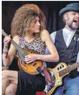
Muddy What

treten in den letzten 10 Jahren performt das Freisinger Singer-Songwriter Duo neben einigen Klassikern Stücke aus Ihren drei Studioalben »Real Unplugged«, »Real Dreams« und »Another Brand New Day«.