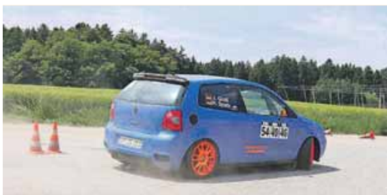
Slalom ist ein optimaler Einstieg.

Insgesamt ist der MSC Slalom Nandlstadt eine wichtige Institution in der lokalen Motorsportgemeinschaft und trägt zur Förderung und Entwicklung des Motorsports in der Region bei. Seine Veranstaltungen und Aktivitäten bieten Fahrern und Fans gleichermaßen die Möglichkeit, ihre Leidenschaft für den Motorsport auszuleben. Das Slalom Event findet ganz-tägig statt.