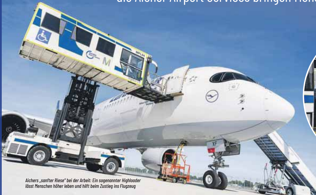
Aichers „sanfter Riese“ bei der Arbeit: Ein sogenannter Highloader lässt Menschen höher leben und hilft beim Zustieg ins Flugzeug

die Aicher Airport Services bringen Menschen zusammen!