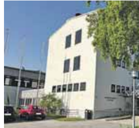
Hier entsteht bald eine staatliche Fachakademie für Sozialpädagogik.

ERDING (red) · »Erzieherinnen und Erzieher haben enorme Bedeutung für unsere Gesellschaft und tragen entscheidend zu einem funktionierenden Miteinander bei. Sie prägen die frühkindliche Entwicklung und legen den Grundstein für die Zukunft unserer Kinder. Angesichts dieses zentralen Auftrags und des riesigen Bedarfs an gut ausgebildeten Fachkräften ist es unerlässlich, potenziellen Interessenten die bestmögliche Ausbildung zu bieten! Mit der neugegründeten staatlichen Fachakademie für Sozialpädagogik in Erding schaffen wir ein weiteres attraktives und heimatnahes Bildungsangebot, um möglichst viele Nachwuchskräfte für die Aufstiegsfortbildung zur staatlich anerkannten Erzieherin beziehungsweise zum staatlich anerkannten Erzieher zu begeistern. Das ist gelebte Heimatpolitik!« betont Finanz- und Heimatminister Albert Füracker anlässlich der Zustimmung zur Errichtung einer staatlichen Fachakademie für Sozialpädagogik in Erding. Kultusministerin Anna Stolz: »Erzieherinnen und Erzieher betreiben und bilden unsere Kinder und tragen damit eine besondere Verantwortung für unsere Gesellschaft. Ich freue