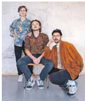
Das Kitsch