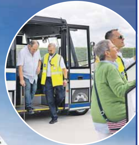
Wenn aus Barrieren Wege entstehen: Service Agents des Aicher Airport Services helfen den Passagieren auf ihrer Reise am Flughafen.

Die Aicher Airport Services suchen derzeit Verstärkung für folgende Stellen: