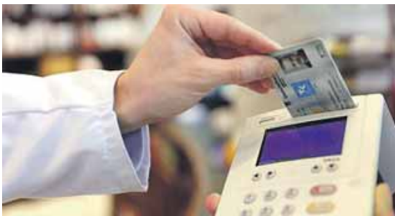
Es könnte so einfach sein: Karte rein und gut. Es besteht noch Verbesserungsbedarf.

(chö) · In einer Welt, in der Technologie allgegenwärtig ist, findet sie zunehmend auch den Bereich des Gesundheitswesens immer mehr Anklang. E-Rezepte, sind ein Beispiel für diese fortschreitende Digitalisierung im Gesundheitswesen. E-Rezepte ersetzen das traditionelle Papierrezept, das Ärzte normalerweise ausstellen, indem sie stattdessen die digitale Form des Rezeptes verwenden. Diese werden direkt an die Apotheke des Patienten gesendet, wo sie bearbeitet und die benötigten Medikamente ausgegeben werden. Der Übergang zu E-Rezepten bietet einige Vorteile. Es verbessert es die Effizienz im Gesundheitswesen, da es den Verwaltungsaufwand für Ärz-