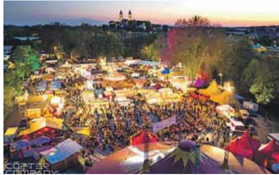
Das Festival der guten Laune.

den. Die Zeltstadt und das Programm finanzieren sich über Sponsoren, die Unterstützung der Stadt Freising und die Standmieten der Marktstände. Die größte Einnahmequelle sind aber die Getränke – nur durch den Verkauf von Bier, Weinschorle, Spezi, Kaffee & Co kann das Festival existieren. Mit jedem gekauften Getränk sorgt ihr also dafür, dass das Festival in dieser Form stattfinden kann. Das Musik- und Kulturprogramm wird dieses Jahr vom